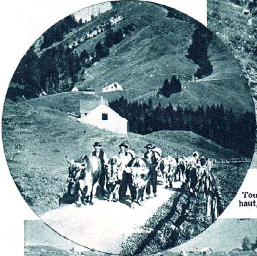
Toujours plus haut, reines en tête.