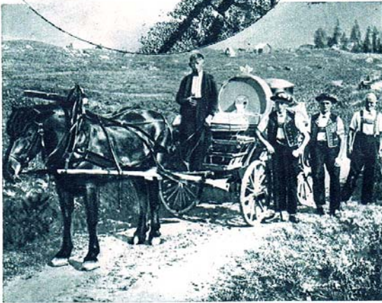
Le fromager suit le troupeau, entouré de ses aides; tous les ustensiles de fromagerie tiennent sur le char.