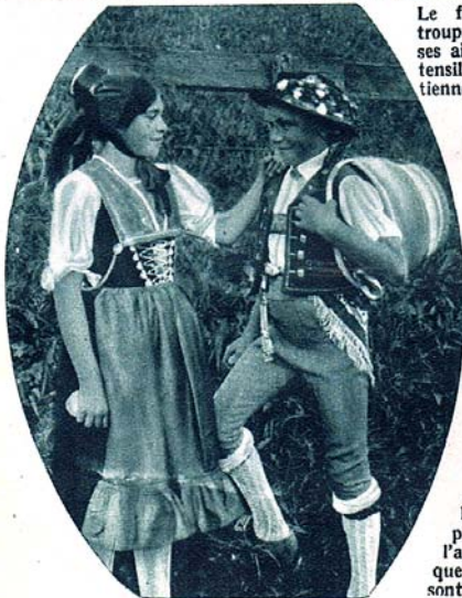
La jeunesse revêt ses plus beaux atours pour monter à l'alpage tandis que les écoles sont en vacance.